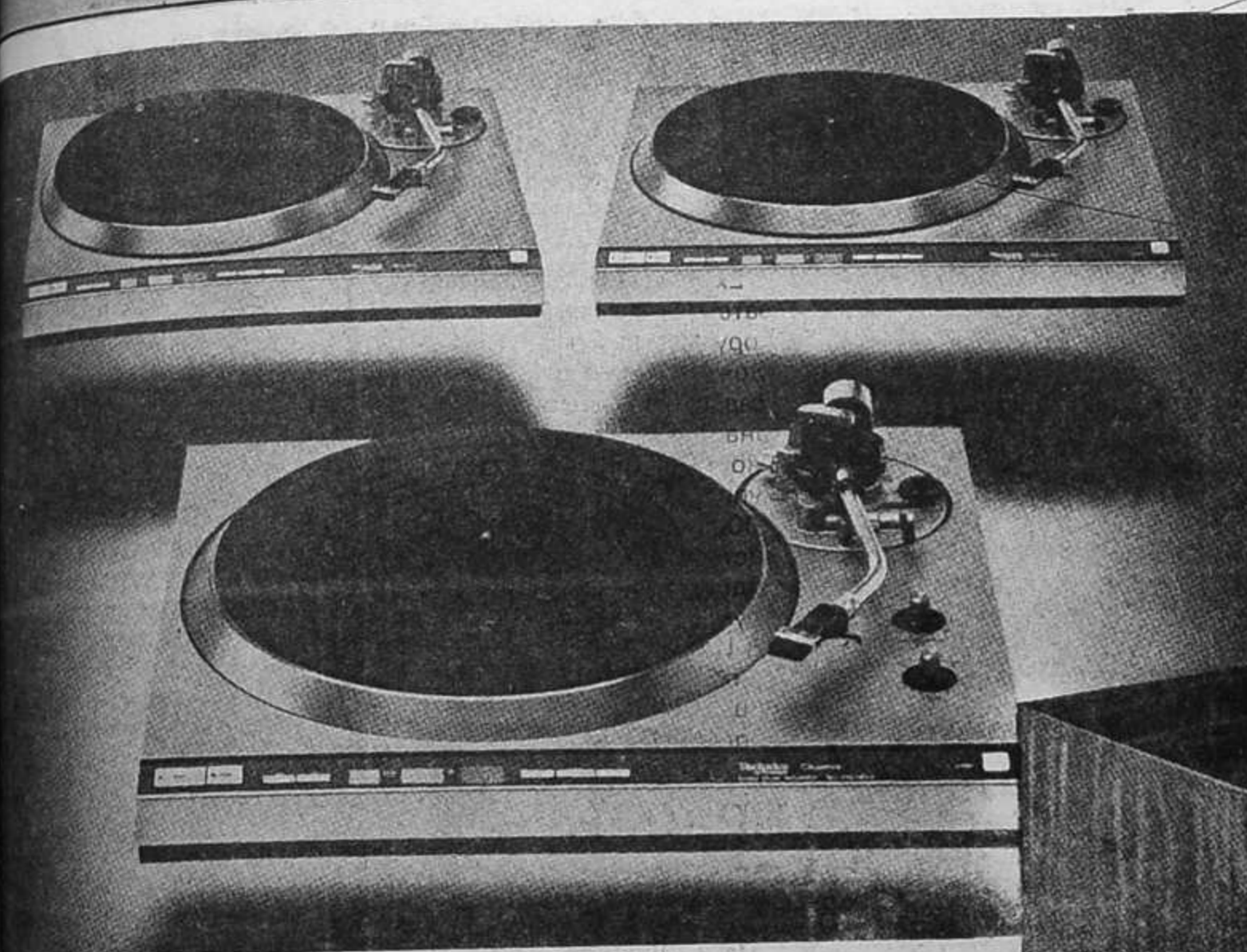
TECHNICS SL 1300/II, SL 1400/II, SL 1500/II

Који одговарајући грамофон? Не знам на који модел мислите кад наводите SANSUI SC 1100, јер је то ознака за један њихов касетофон, а не грамофон. Но, у сваком случају, ваш је избор — један од грамофона јапанске продукције TECHNICS, али не SL 2000. Рекло би се да, као најбоља решења, долазе у обзир SL 1300 Mk II, SL 1400 Mk II и SL 1500 Mk II. Разликују се само по томе што је први аутоматски, други полуаутоматски, а трећи без икакве аутоматске ручке.